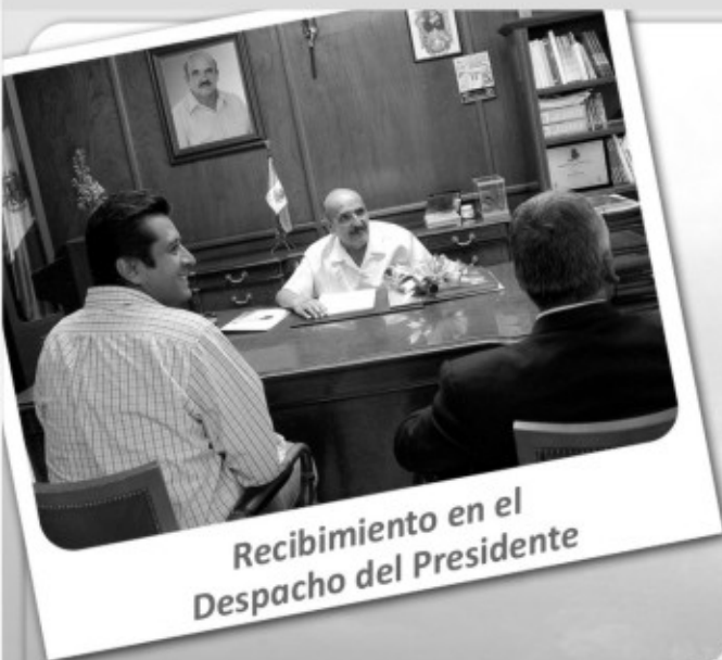
Recibimiento en el Despacho del Presidente