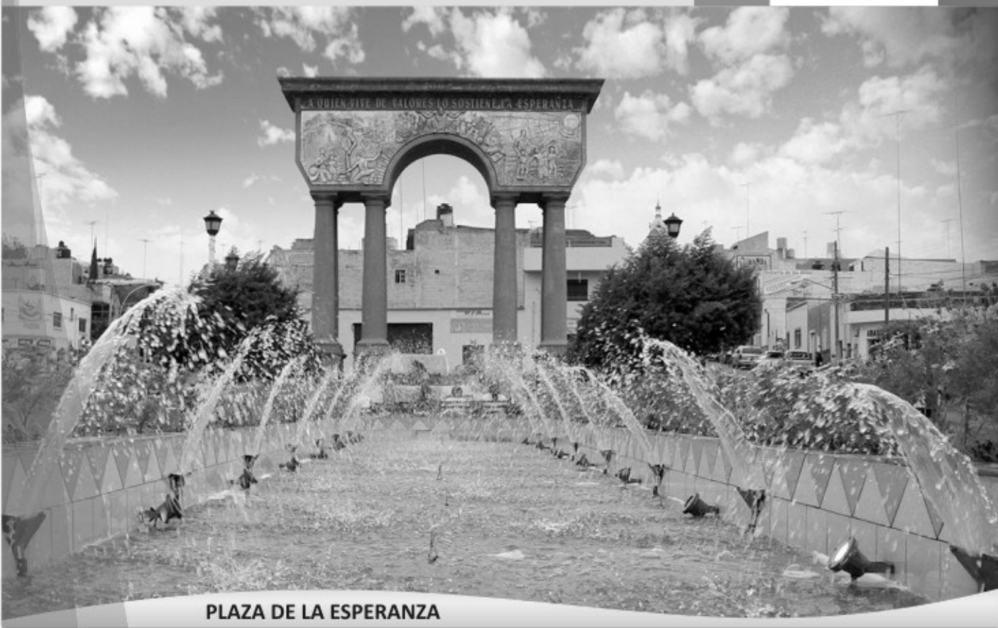
PLAZA DE LA ESPERANZA