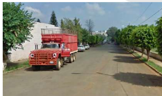
Imagen 1. Espacios de grandes instalaciones del Municipio

Dentro del municipio de Tepatitlán Jal. Se incluyen también los cauces de arroyos y ríos que debido a la baja actividad humana en la zona, propician actividades delictivas en la zona.