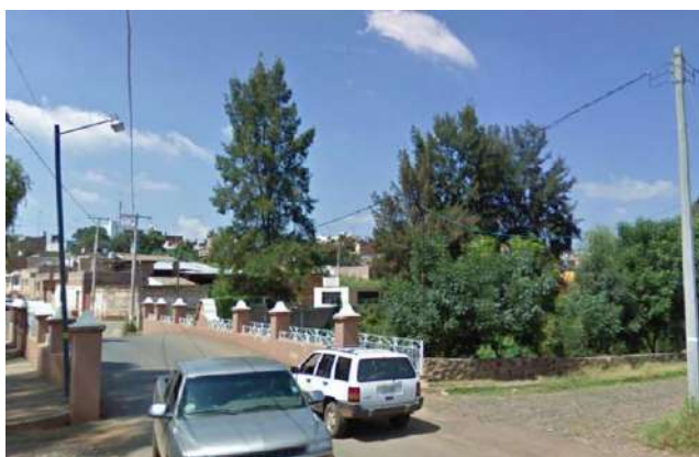
Imagen 5: De izquierda derecha: Cruce de Pantaleón leal y calle Nicolás Bravo y Calle Guadalupe Becerra y Unidad Deportiva

Se refiere a espacios con gran actividad y afluencia de personas en el horario diurno, como es el caso de centros educativos, deportivos y de reunión. Esta alta concentración de personas propicia un paulatino cambio de uso de suelo, de ser habitacional a comercial y de servicios,