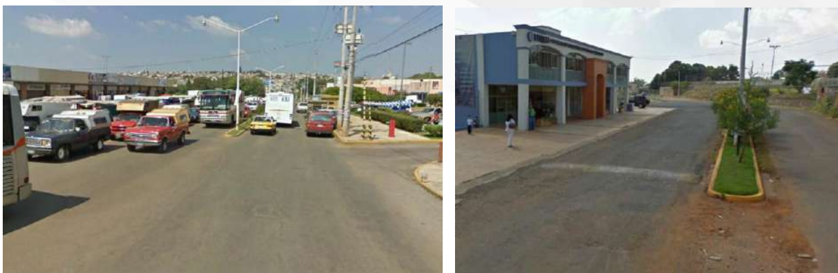
Imagen 7: De Izquierda a Derecha; Zona Central de Autobuses y Zona de Parque el Pipón