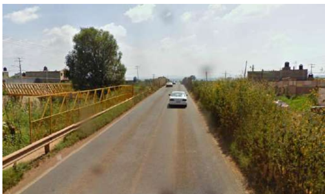
Imagen 2: Zona de la Nueva Cruz

En numerosas calles de la ciudad, la deficiencia en el sistema de alumbrado público en la zona, genera espacios oscuros en los que no se puede tener una vista clara de las actividades que se están realizando, sumado a esto, existen zonas en las que la amplitud de las banquetas, en conjunto con la vegetación invasiva que poseen debido principalmente a la falta de mantenimiento, propician aun en mayor medida, la generación de espacios oscuros u ocultos