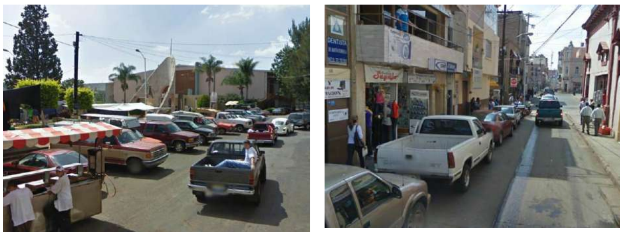
Imagen 6, De izquierda a derecha: Zona Auditorio Miguel Hidalgo y Zona Centro Histórico