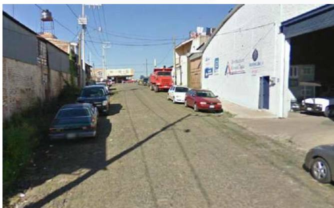
● Imagen 3 De izquierda a derecha: Zona Bodegas Nueva Española v Zona del Panteón